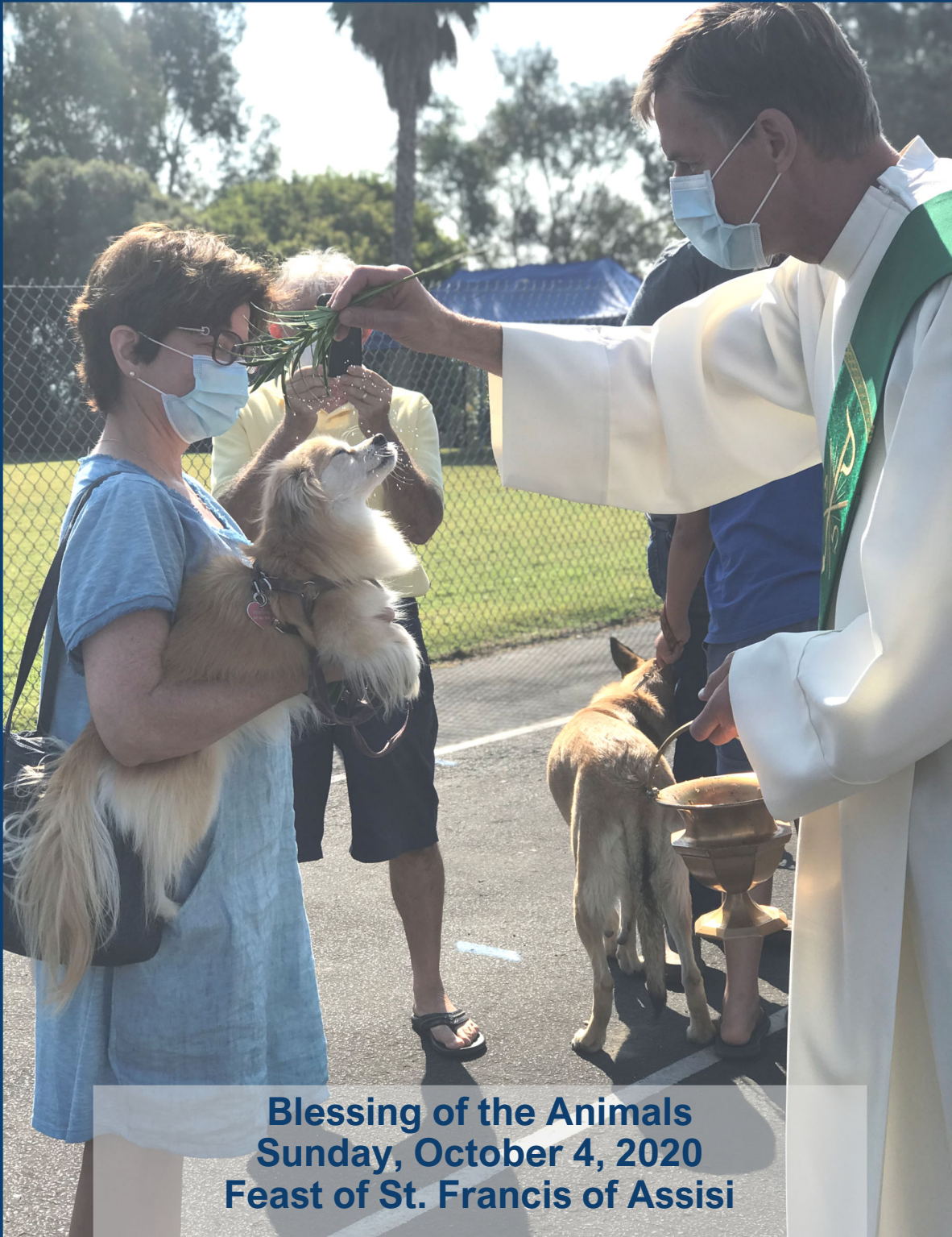
Blessing of the Animals Sunday, October 4, 2020 Feast of St. Francis of Assisi

Under the care of the Eudist Fathers of the North American Province